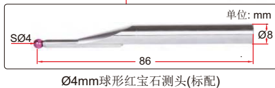
Ø4mm球形红宝石测头(标配)